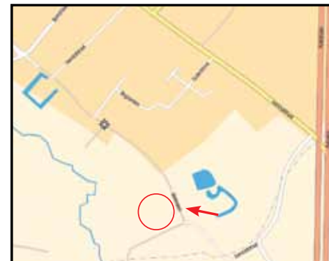
LONDERZEEL recyclagepark Beemden