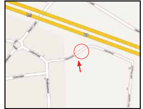
VILVOORDE-KONINGSLO recyclagepark Klein Hoogveld