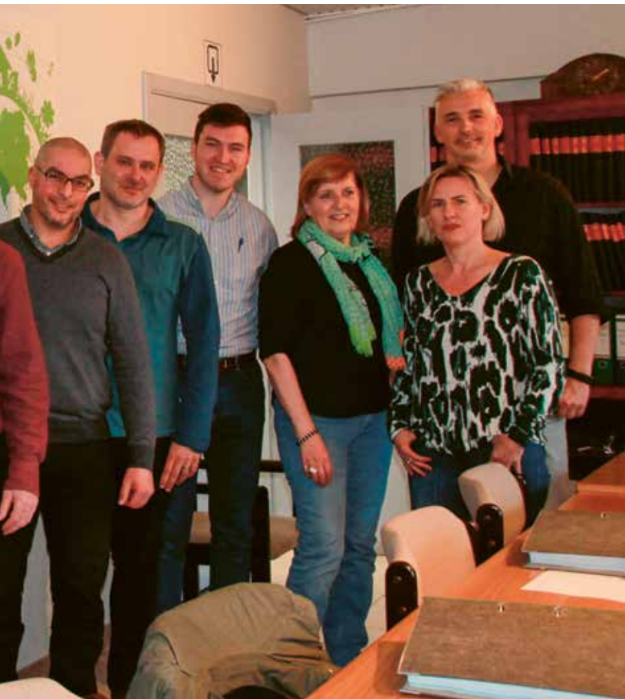
Raad van Bestuur (samenstelling 2019)